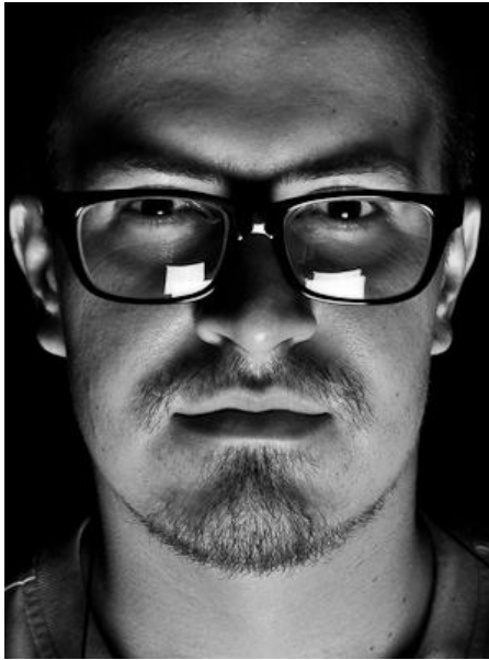
Дмитрий Мотинов Фотограф-фрилансер фотокорреспондент

I-Media Marketing Communica- tions Bureau bulak.kg ИТАР-ТАСС МК - Азия Молодежный журнал "Erpan" Газета "Лимон"